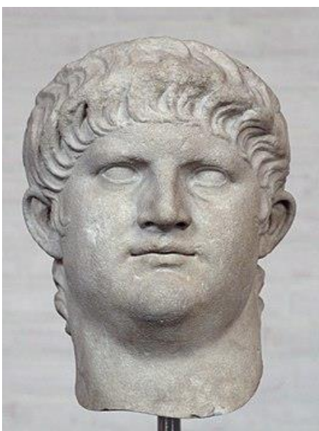
Wizerunek cesarza Nerona

Dnia 15 grudnia roku 63 odbędzie się uroczystość z okazji 26 urodzin najwspanialszego poety rzymskiego, człowieka o wielkich zasługach i olśniewającej inteligencji - Nerona Claudiusa Augustusa Germanicusa. Z okazji urodzin człowieka tak wspaniałego odbędą się igrzyska jakich w Rzymie jeszcze nie widziano. Przewidziane są wielkie i wystawne uczyty, walki gladiatorów odtwarzające największe zwycięstwa w historii Imperium oraz inne atrakcje. Więcej szczegółów na ten temat podamy w wydaniu następnym.